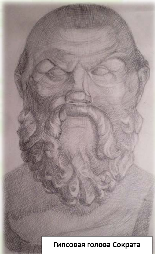
Гипсовая голова Сократа