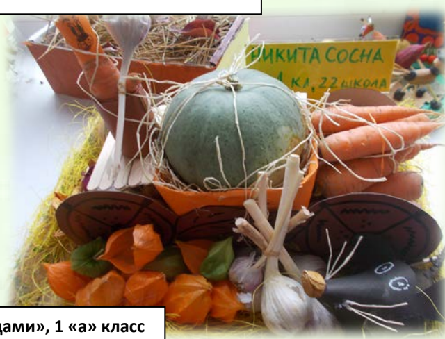
«Карета с овощами», 1 «а» класс