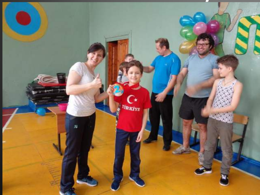
Медаль за почётное II место