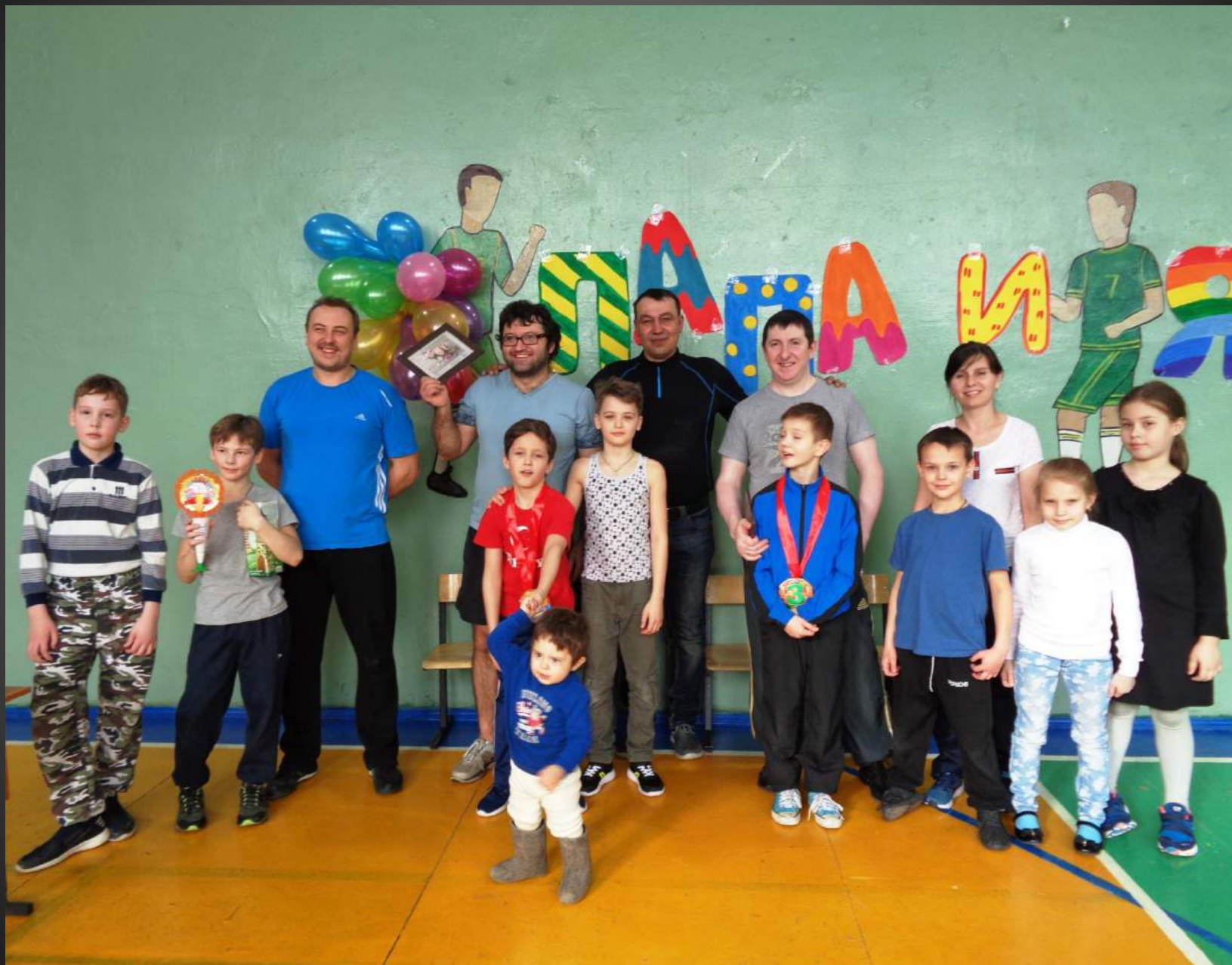
Фото на память!