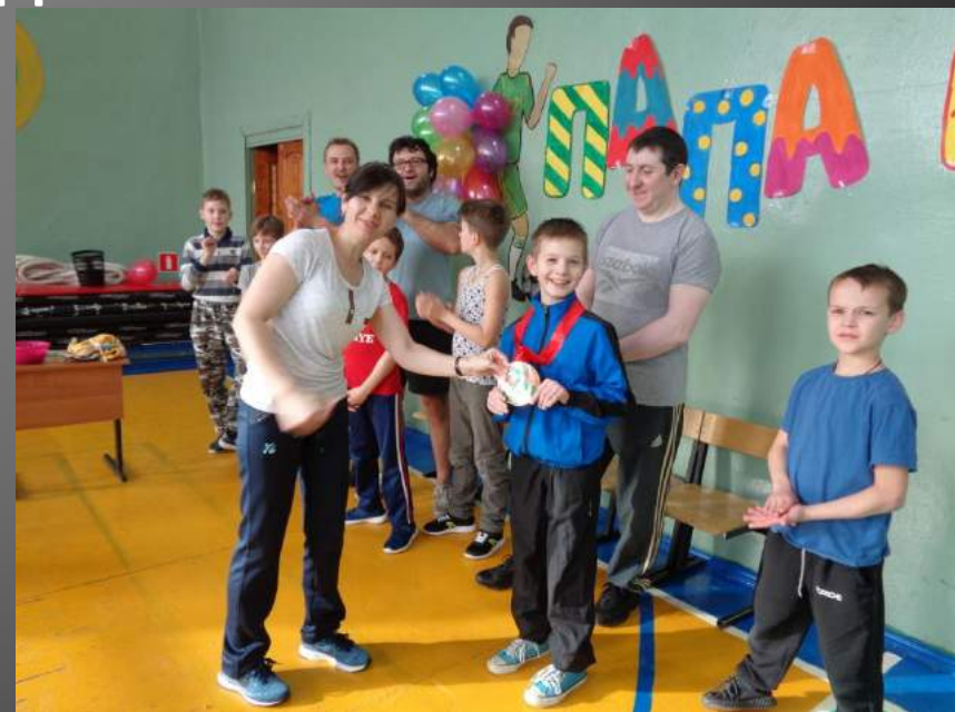
Медаль за почётное III место