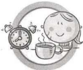
СОБЛЮДАЙТЕ ПРАВИЛЬНЫЙ РЕЖИМ ПИТАНИЯ