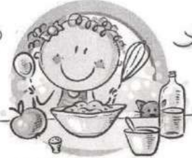
СЛЕДУЙТЕ ПРИНЦИПАМ ЗДОРОВОГО ПИТАНИЯ И ВОСПИТЫВАЙТЕ ПРАВИЛЬНЫЕ ПИЩЕВЫЕ ПРИВЫЧКИ