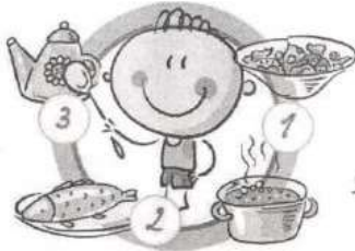
НЕ ПРОПУСКАЙТЕ ПРИЕМЫ ПИЩИ