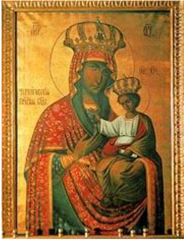
Черниговско-Гэфсиманская Божия Матерь

Первые здания монастырю были переданы 12 лет назад и сразу начались восстановительные работы, которые продолжаются и доныне. Отремонтирован центральный пятиглавый собор. Этот храм настолько прекрасен, что воистину кажется кораблем, плывущим в пространстве. И назван он по имени иконы Божией Матери Черниговско-Гэфсиманской*. В этом же соборе хранится великая святыня монастыря – мощи преподобного Варнавы, прославленного в сонме радонежских святых. Память его совершается 17 февраля (2 марта). К нему ехали со всех уголков страны, чтобы узнать волю Божию. Его предсказания сбывались с абсолютной точностью, как салось ли это одного человека или целого государства. Посещал его со всей семьей в начале 1905 года последний русский император. Разговор со старцем помог ему принять судьбоносное решение, изменившее жизнь всей нашей страны. Известно, что именно в этот год Николай II получил благословение на принятие мученического венца. Старец Варнава был духовным отцом преп. Серафима Вырицкого и всех насельников Гэфсиманского скита.