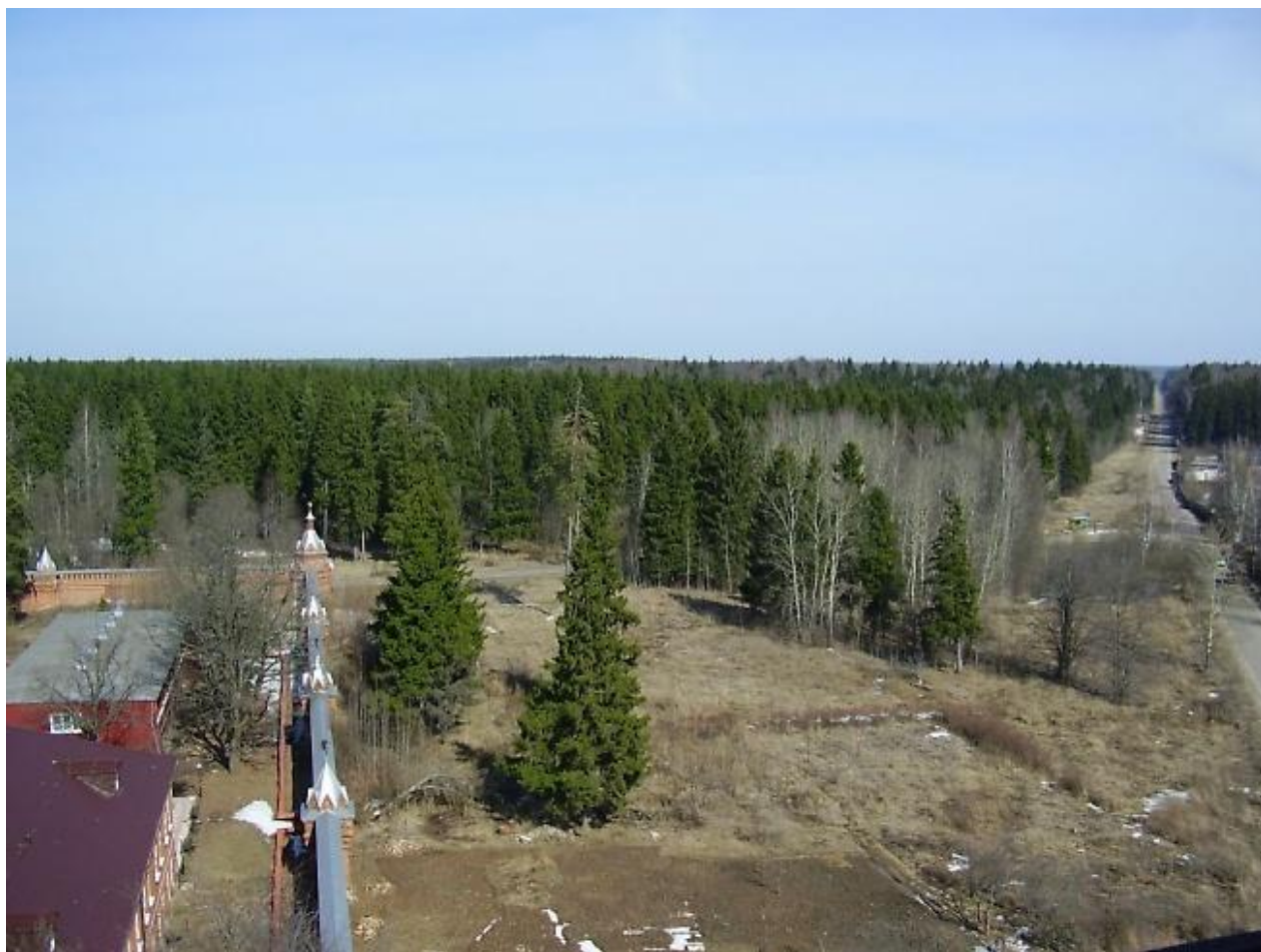
Гефсиманский лес (вид с колокольни)

Прекрасны окрестности Радонежские! Не зря в свое время здесь любили отдыхать цари. Совсем близко от скита находится свидетель давних времен - небольшое, но очень красивое озеро «Екатерининский пруд», названное так в честь царицы.