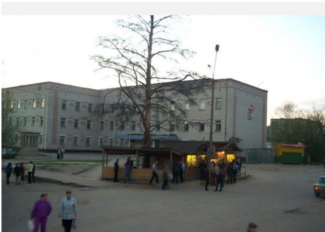
Последняя сосна Коршуновского бора у 144 центральной военной поликлиники в пос. Ферма. Конец 90-х.

В результате вырубки товарного и топливного леса и освоения значительной части роци под строительство (Черниговский скит с примыкающими постройками, Киновия и др.) к началу XX века площадь леса сократилась до 141 десятины (данные на 1915 г., приведены в статистическом справочнике "Сергиевский уезд Московской губернии", Сергиев, 1925). Уже тогда люди осознавали, что уникальную природную зону необходимо сохранять и по возможности восстанавливать. Так, часть нарушенного лесомассива к востоку от Черниговского скита в начале XX века была восстановлена насаждением лиственных деревьев (берез).