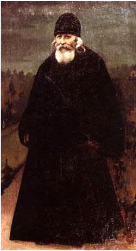
Преподобный Варнава Гефсиманский

Начало одному из них положил в середине XIX века юродивый Филиппушка (ум. В 1868), принявшийся копать пещеры неподалеку от Гефсиманского скита. Потом Лавра прислала в помощь рабочих. В большой пещере был устроен подземный храм во имя архангела Михаила, освященный в 1851 году. А наверху поставили деревянную церковь, на месте которой впоследствии возвели новый, каменный, в честь Черниговско-Гефсиманской иконы, который и стоит донныне. Устав скита отличался особой строгостью. Пост, постоянная молитва, запрет на празднословие, иноческое уединенное житие – все было направлено к спасению души.