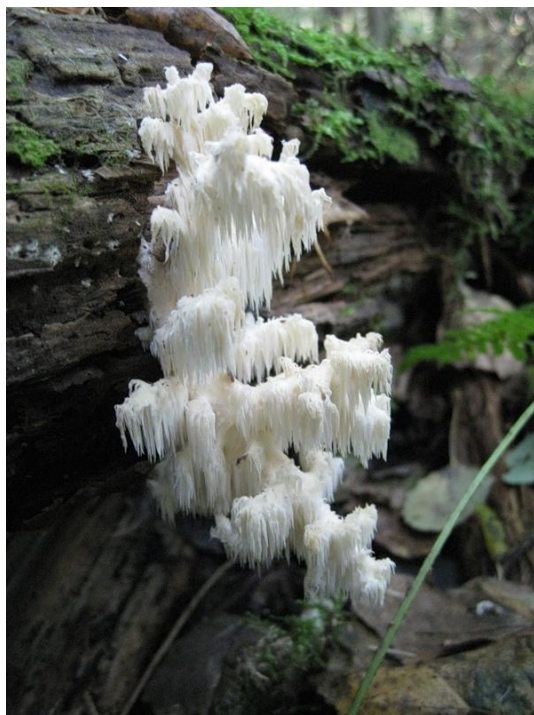
Ежевик кораллоподобный – украшение Гефсиманского леса

Подлежат охране также некоторые виды лишайников (около 22 наименований) и мохообразных (около 37 наименований).